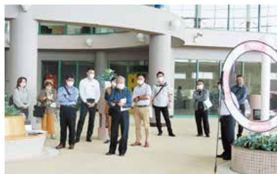
ドローン操縦体験

4 日目は、佐賀県多久市で、「進行する過疎化 拡大する地域間格差」の課題に直面した多久市が取り組んでいる「ドローン × まちづくり」等の説明を受けました。多久市は、ドローンを活用して「そらのまちおこし」としてドローン配送の「空の道」を実現させ、「空のシェアリングエコノミー(空の道構想)」を進めており、テレビ番組「ガイアの夜明け」や「がちりマンデー」で全国放送され注目を集めています。説明を受けた後は、ドローンの操縦体験も行い、参加者はドローンの平和的な可能性を実感していました。