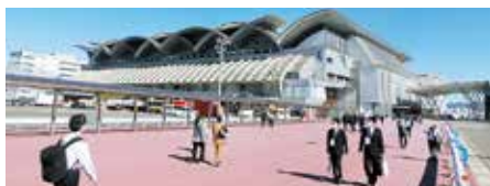
分科会会場マリンメッセ福岡B館

大会 2 日目と 3 日目は、 分科会 (会場：福岡国際会議場、マリンメッセ福岡A館)となり、各分科会「 製造業安全対策官民協議会特別セッション 」、「 マネジメントシステム・リスクアセスメント 」、「 安全管理活動 」、「 機械・設備等の安全 」、「 安全衛生教育 」、「 ゼロ災運動 」、「 労働衛生管理活動 」、「 メンタルヘルス・健康づくり・健康経営 」、「 DX等 」、「 交通安全、防災・危機管理 」、「 海外安全衛生、ダイバーシティ、第三次産業 」及び「 化学物質管理活動 」において、全国の事業場からの研究発表をはじめ、最新の安全衛生の課題に対応した講演、パネルディスカッション等が開催され、大会参加者は自社の安全衛生活動の参考となる分科会に参加していました。