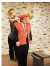
古波津会長還暦祝い