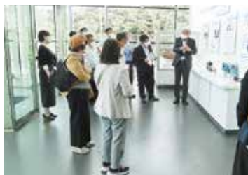
水素エネルギー製品研究試験センター視察

3泊4日のコース参加者は、10月21日(金)午後からは、観光バスにて福岡県糸島市にある「(公財)水素エネルギー製品研究試験センター」を視察しました。同センターは、二酸化炭素を排出しないクリーンなエネルギーである水素エネルギー新産業への参入を支援するため、水素関連製品(素材・部品等)の研究試験を行っており、地球温暖化対策にもなる水素エネルギーの時代が近づいていることを実感しました。