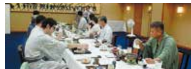
夕食&美酒&カラオケ

ツアー 3 泊目は、日本三大美肌の湯と言われている佐賀嬉野温泉に泊まり、温泉、食事、美酒、カラオケ、旅館のおもてなしを堪能しました。