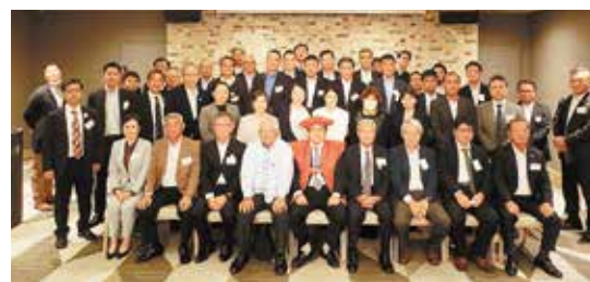
参加者全員で記念写真