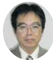
那覇労働基準監督署 署長