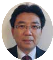
沖縄労働局 労働基準部賃金室長

皆さまにおかれましても、若夏の季節に労働保険料を申告していただき、労使のご協力による益々のご繁栄により、来春に喜びを分かち合えますよう祈念いたしまして、着任の挨拶とさせていただきます。