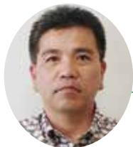
八重山労働基準監督署 署長