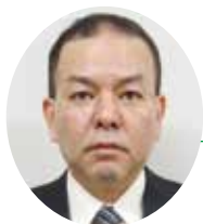
沖縄労働基準監督署 署長