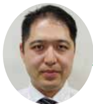
沖縄労働局 労働基準部労災補償課長