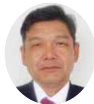
名護労働基準監督署 署長