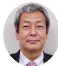
沖縄労働局 労働基準部健康安全課長

最後になりますが、貴協会並びに各会員の皆様の御繁栄と御健勝を祈念いたしまして着任の挨拶とさせていただきます。