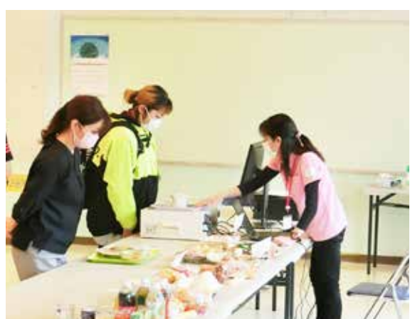
わかりやすい栄養指導