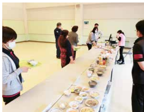
チェックしたい食事のフードモデルを選んでトレイに乗せます。

食育セミナーは、「体験型」栄養教育システムを利用し、参加者がICタグを内蔵したリアルな実物大のフードモデルから普段食べている一食分を選んでトレイに乗せ、センサー台に置くと栄養価計算とその食事のバランスをチェックし、星5つで判定され、管理栄養士によるわかりやすい栄養指導が行われて、自分自身の理想的な食生活が直感的に理解できる内容となっておりました。また、待ち時間等を利用して研修室では認知機能向上のための運動も行いました。