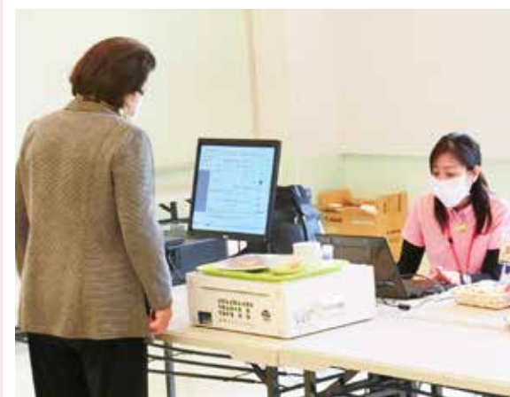
センサー台に乗せると、ICタグで瞬時に判定