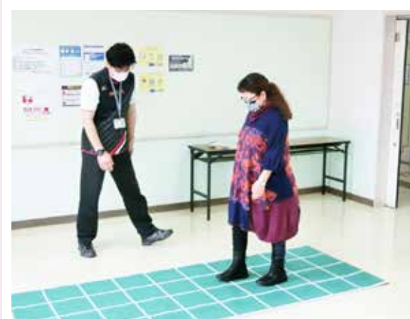
認知機能向上運動